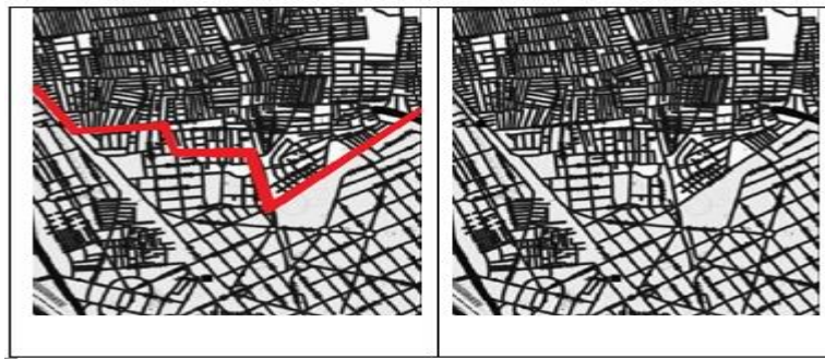
شكل 1 حيز التجاور بين منطقتى دار السلام شمالاً والمعادى جنوباً ويشكل الحد الفاصل بين المنطقتين شارع رئيسى

يمثل الحد الفاصل بين المنطقتين مجموعه من محاور الحركة وهى شارع 77 وشارع حلوان الزراعى، ويعتبر النسيج العمرانى للمعادى نسيج نقطى تنتظم فيه شبكه الشوارع وفقاً لنسيج إشعاعى أما النسيج العمرانى فى منطقه دار السلام فيعتبر نسيج شريطى متضام ناتج من تقسيمات الأحواض الزراعيه للأرض المقام عليها المباني . حيث أنها مباني غير مخطظه على أراضي زراعيه تتخذ شوارعها نسيج منتظم ، وتختلف النسب البنائيه حيث تكثر المباني والكثافه فى منطقه دار السلام . أما فى المعادى فتكثر الفراغات المفتوحه المرتبطه بالمياطين التى تعتبر نقاط مركزيه تتفرع منها شرايين الحركة الرئيسيه ، وتعكس هذه العلاقه تناقضاً واضحاً فى النسيج العمرانى.