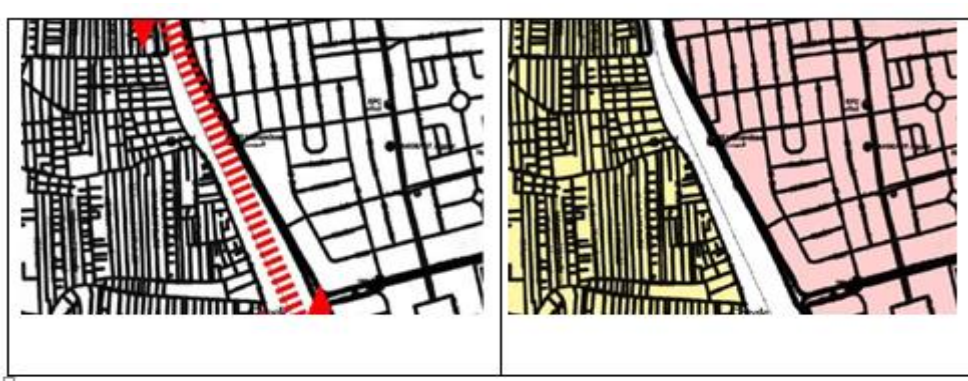
شكل 3 حيز التجاور بين منطقتي المهندسين وبولاق الدكرور ويمثل شكل الحد الفاصل بين المنطقتين السكة الحديد

يمثل الحد الفاصل خط السكة الحديد ، وتختلف طبيعته النسيج العمراني لمنطقه المهندسين عن طبيعته النسيج العمراني لمنطقه بولاق الدكرور . حيث يعتبر نسيج المهندسين نسيجاً منتظماً بما فيه من شبكة الشوارع ، وتمثل النسبة البنائية فيه 35% . أما بولاق الدكرور فيعتبر نسيجها شريطي ومقسم طبقاً لتقسيمات الأحواض الزراعيه المقام عليها المباني ، وتقسم الشوارع وفق نسيج منتظم وتمثل النسبة البنائية في بولاق الدكرور 72% ، وتعكس علاقته التجاور بين منطقه المهندسين وبولاق الدكرور حاله من حالات التناقض الواضح في النسيج العمراني.